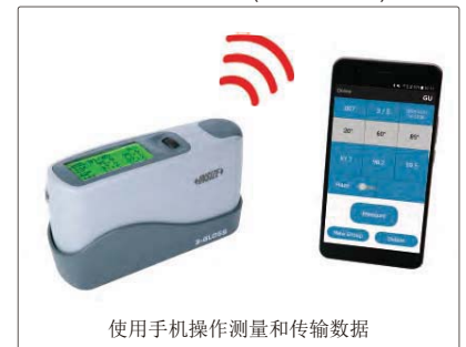
使用手机操作测量和传输数据